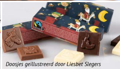
Doosjes geïllustreerd door Liesbet Slegers