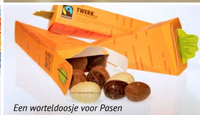
Een worteldoosje voor Pasen