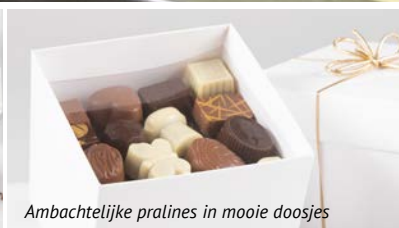
Ambachtelijke pralines in mooie doosjes